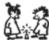
Fiire mit de Chliine

Kleinkindergottesdienst für Kinder zwischen 2 und 5 Jahren und ihre Familien am Samstag, 23. Juni, um 10.00 Uhr in der kath. Kirche Rehetobel.